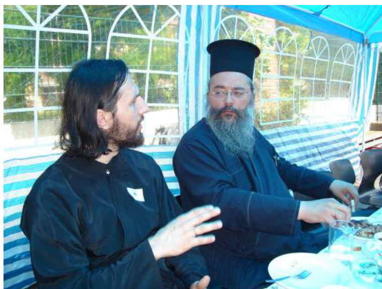
V.. Athanasios π. Αθανάσιος